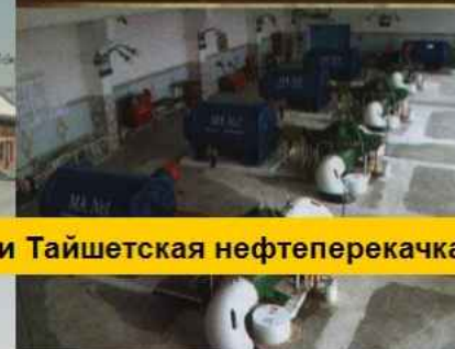
Нефтепровод Туймазы – Ангарск и Тайшетская нефтеперекачка