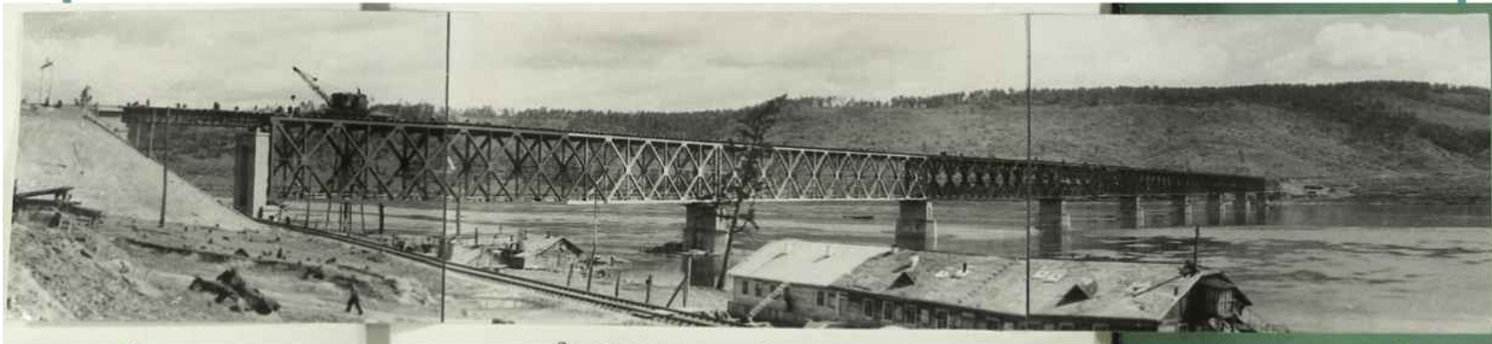
Ж/д мост через Ангару в районе Падунских порогов