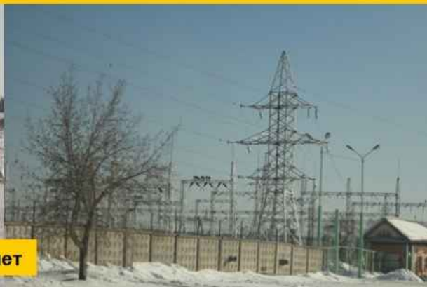
ЛЭП – 500, Камала – Тайшет и Тайшетская подстанция