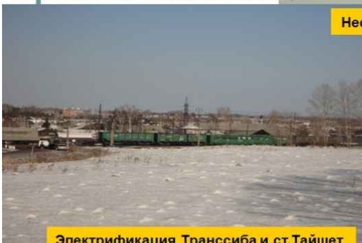
Электрификация Транссиба и ст.Тайшет