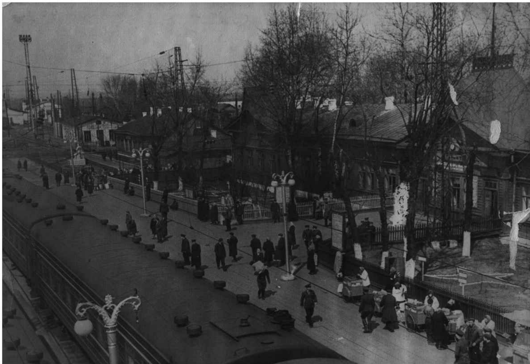
Перрон станции Тайшет на который шагнул мой дед в далеком 1960 г.