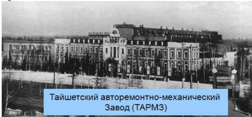
Тайшетский авторемонтно-механический Завод (ТАРМЗ)