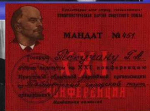
Мандат делегата областной конференции КПСС