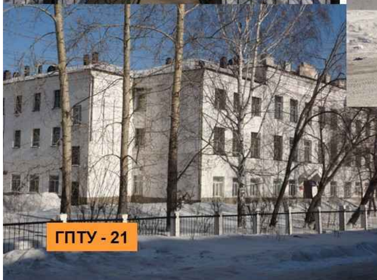
ГПТУ - 21