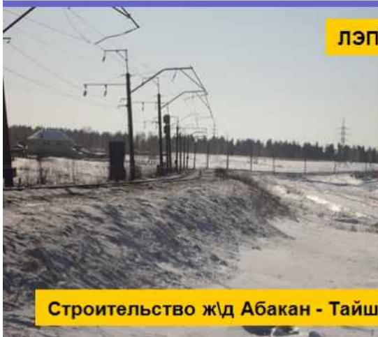
Строительство ж\д Абакан - Тайшет