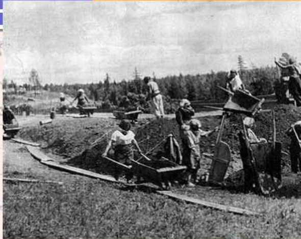
Женщины-заклученные на строительстве насыпи западного участка БАМа в 1949 году

Агинский Бурятский авт. округ (1), Агинское