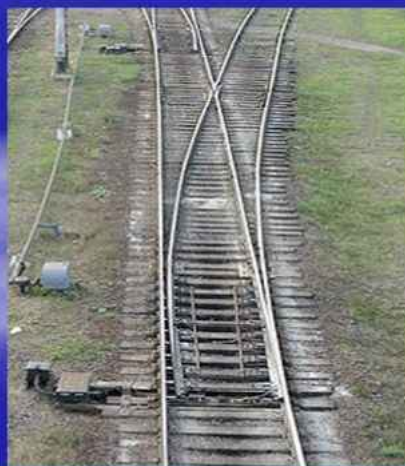
Стрелочный перевод – устройство для перевода поезда С одного пути на другой