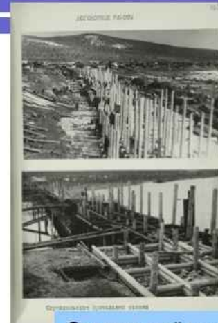
Осетровский речной порт, Усть-Кут