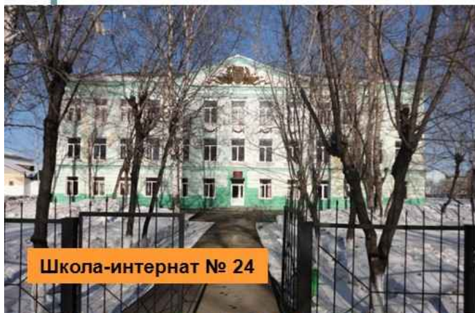
Школа-интернат № 24

СУ-21 «Ангарстроя» возводил жилые дома, здания учебных и медицинских учреждений по улицам им.8 марта, им.Крупской, им. Шевченко, им.Терешковой