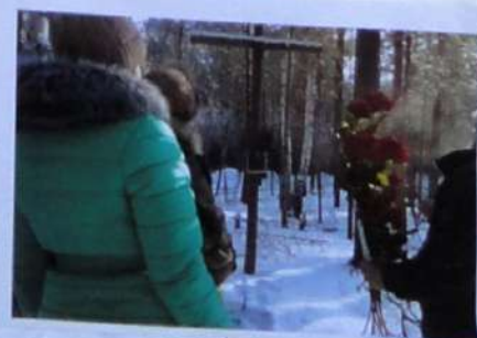
29 октября 2016 г. У первого креста-памятника, установленного школьниками - краведами в 2003 году на кладбище Озерлага на ст. Топорок