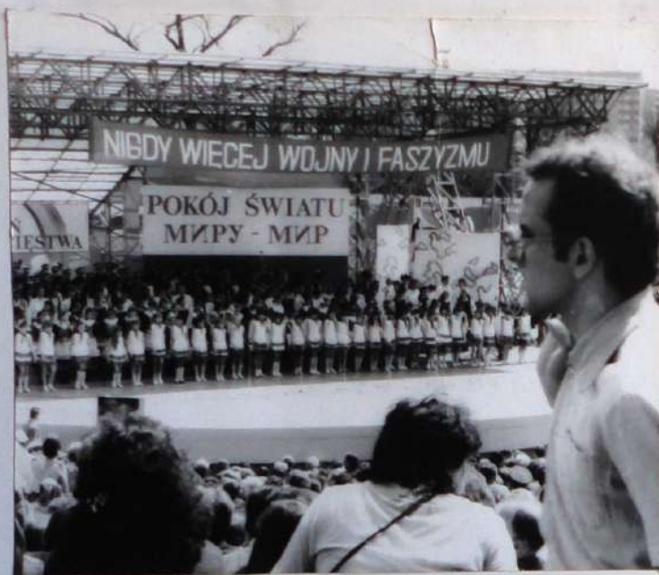
1981 год, Польша, г.Белосток, продолжение 4 мая