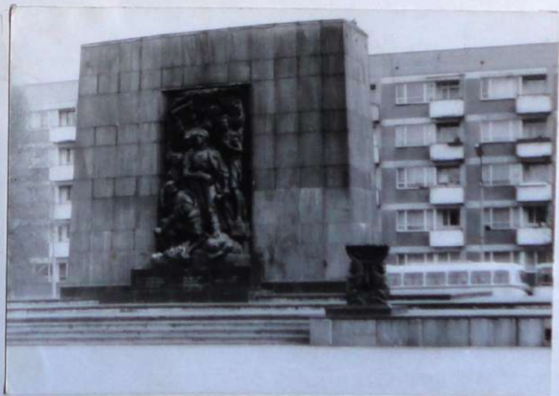
Варшавское восстание узника еврейского гетто 1943 года. Памятник героям гетто. Варшава, 1948 г., скульптор И.Рангопорт, архитектор Л.Сунд.