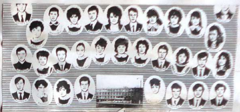
11 - в классе школы № 60. Эти ребята в октябре 1988 года решили создать официальное объединение "История" для сбора материалов о политических репрессиях в своем районе. У тех же, вот уже свыше 10 -ти лет работает это объединение, которое сейчас ие "История". Основной целью стала работа над созданием летописи Таймыта и Таймтского района.