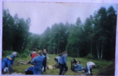
Участники экспедиции на архиве.