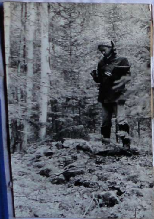
Целию одной из экспедиций ЛПО "Бирюза" стало изучение таежного оловянного рудника в верховьях р. Тагул на ручье Лада. По сведениям жителей Соляной на руднике в годы войны использовался труд заключенных.