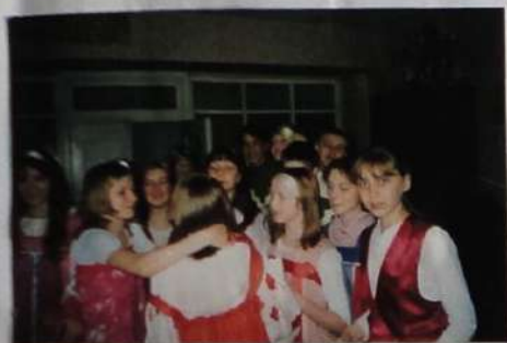
«Б.М.-вешняк» готовится к выходу на сцену конференции