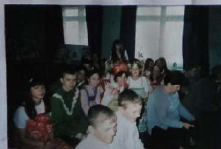
Члены ИПО «Бирюса-Мемориал» в зале конференции.