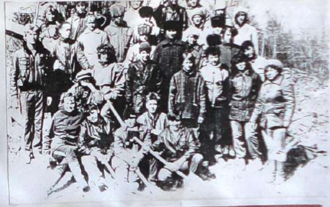
Ученики школы № 60, члены общества "История" на первом городском уроке по сбору материалов о жертвах политических репрессий. В зале, как и на уроке, в их среде появились в Таймыта - станице починило известное общество "История".