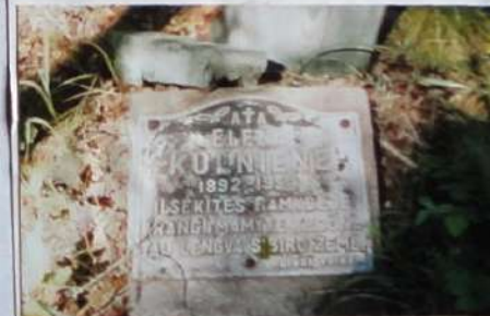
Могильная плита – тоже источник исторических сведений. Надо просто уметь извлекать эти сведения.