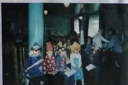
На НПК было много различных детских краеведческих объединений, клубов.