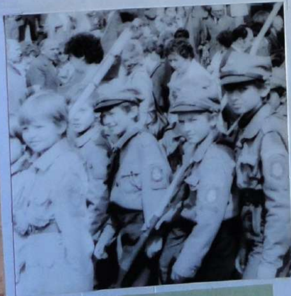
Польские карьеры - члены добровольной массовой организации детей и молодежи на первомайской демонстрации в Варшаве.