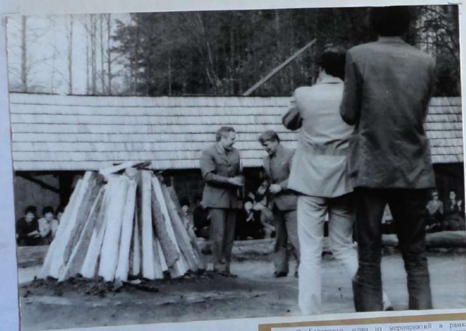
В Беловежье, одно из мероприятий в рамках обмена молодежными делегациями и ветеранами войны СССР-Польша и связи с празднованием Дня Победы.