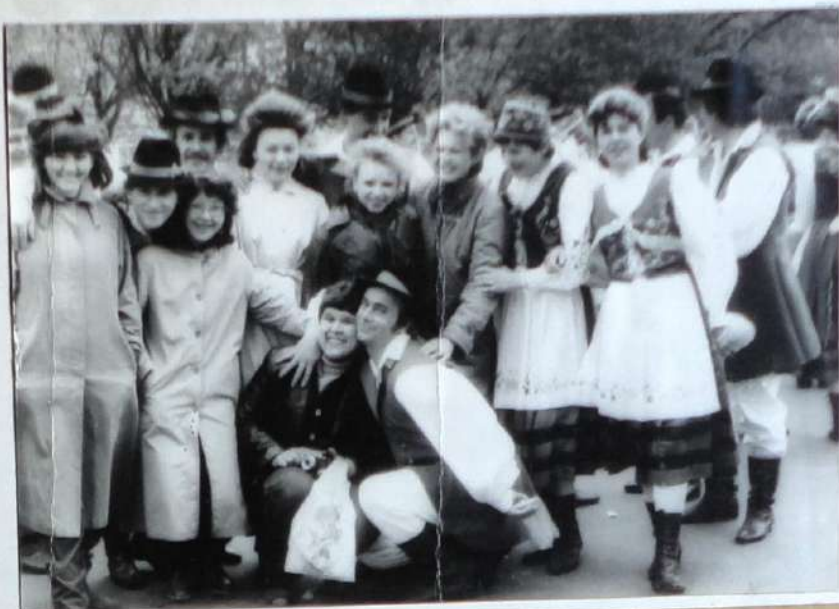
Участники поезда дружбы СССР-Польша во время первомайской демонстрации в Варшаве.