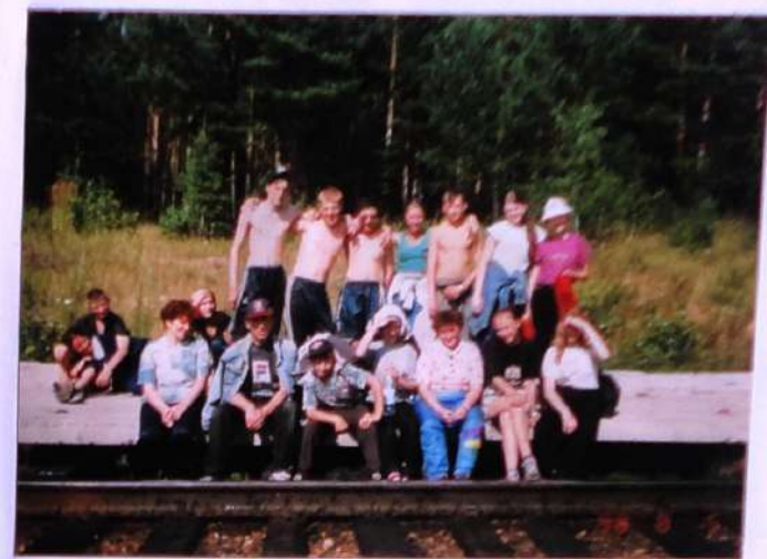
Группа краснодарской экспедиции 1998 г.