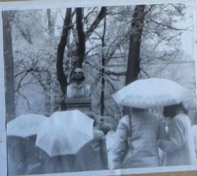
У памятника Н.Копернику, музея В.И.Ленина и в «Вольфем» доглов Гитлера