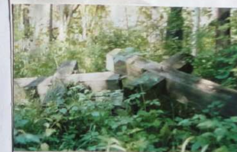
Так выглядят захоронения умерших в годы депортации литовцев.