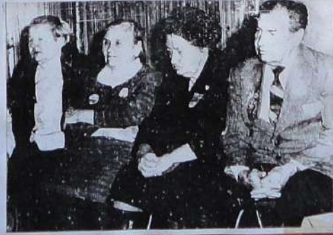
Самое первое мероприятие "История" - День учителя / день молодежи (вместе с другими политическими репрессиями) - 30 октября