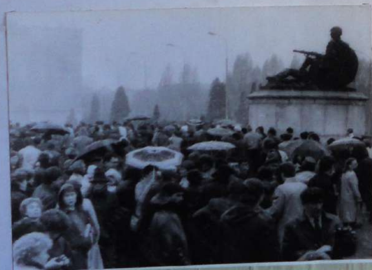
1 мая 1981 год. - Варшава, мемориальный комплекс освобождения Польши немецко-фашистских захватчиков.