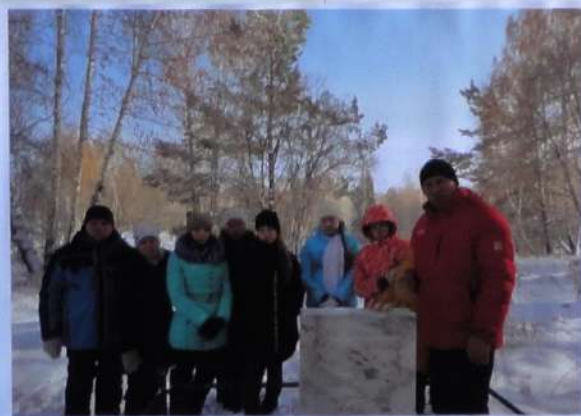
У памятника узникам Озерлага незаконного арестованным и умершим в неволе. 30 октября 2016 г., Золотая гора.