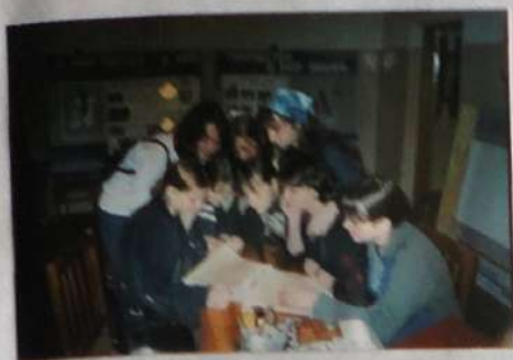
НПК «Край тайга, легенд и песен» – дело серьезное, так что без подготовки не обойтись