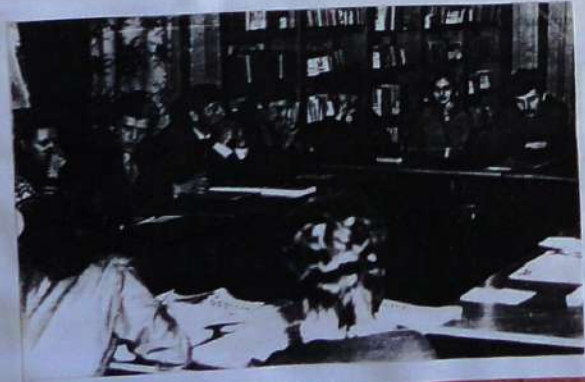
Наши на время работы нашей тематической "История" - участие в отечественной конференции на тему А.С. Пушкина "Судьба поэта". А также участие в межрегиональной конференции "А.С. Пушкин, Иркутск, О. Соловьевичи".