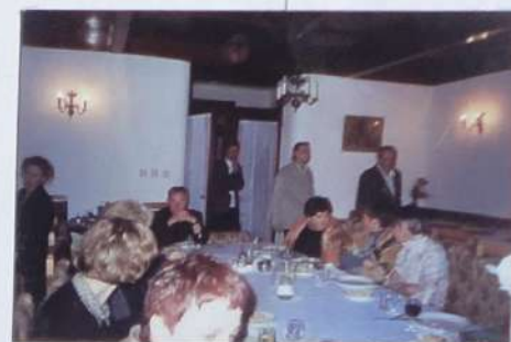
Рабочие моменты российско-польского семинара учителей истории « Существуют ли польско-российские отношения? Польские и российские интерпретации общей истории».