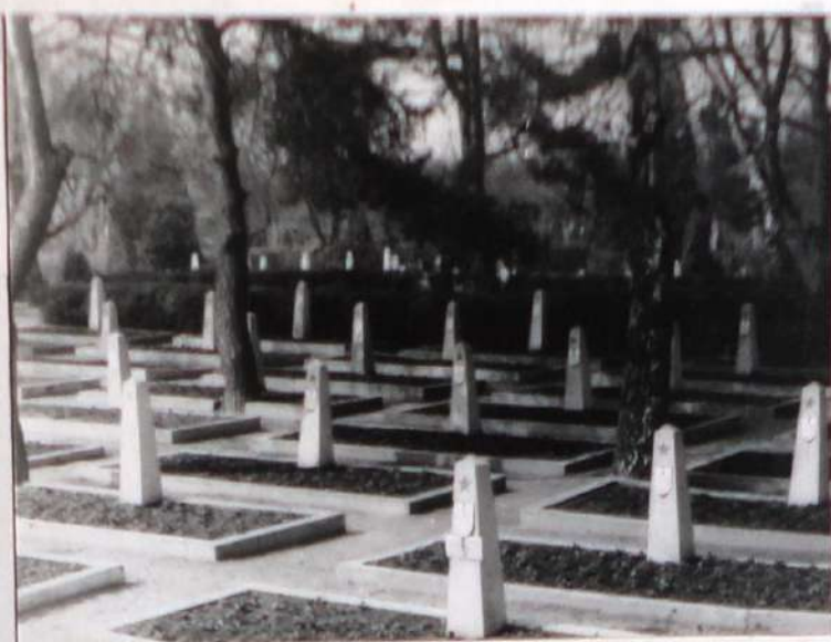
Делегация молодежи и ветераны войны Иркутской области в составе Польши Дружба и Польша. Май 1981 года.