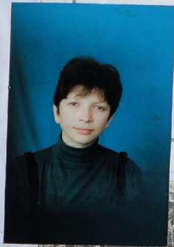
Тайшет, 1999 год