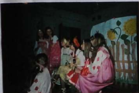
«Бирюса-Мемориал» представила на НПК свою художественно-историческую композицию «На завалинке» – о досуге молодежи села Контгорка в к.19-нач.20 века.

Научно-практическая конференция школьников-краеведов «Край тайга, легенд и песен» – ежегодное центральное мероприятие для краеведов. «Бирюса-Мемориал» постоянный участник этой конференции. Ежегодно члены «Б.М.» представляют на конференции интересные исследовательские работы по самым различным темам: история депортации народов СССР, история кулацкой ссылки, Тайшетский район в годы Великой Отечественной войны и др. НПК – хорошая школа для проверки качества своей исследовательской работы, своих умений и навыков вести научное исследование. Эти навыки пригодятся во время учебы в колледжах и институтах после школы. Участие в городских НПК поможет подготовиться к областным конференциям «Байкальский колыбель», «Шаг в будущее, Сибирь!» и к Всероссийскому конкурсу исторических исследовательских работ «Человек в истории. Россия. XX век. Исследовательские работы ребят из «Б.М.» – это недостающие страницы истории нашего района и города.