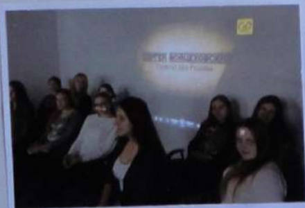
На просмотре видеофильма "Сергей Войцеховский - Генерал Без Родины"