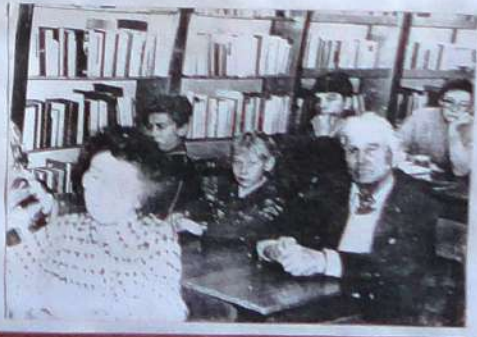
Члены "История" на встрече в библиотеке имени А.С. Пушкина "История" в своем районе в г. Таймыта - станице.