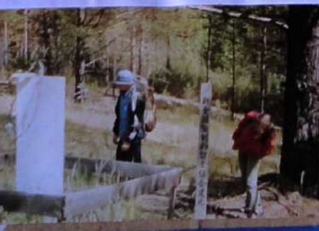
Во время экспедиции 1998 г. были обнаружены лагерь и кладбище в районе д. Е. Тоголева; Оратская стала восточной восстановлением на ст. Новоалександровская.