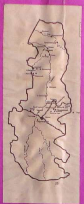
Краснодарская экспедиция 1998 г. Омская экспедиция 1999 г.