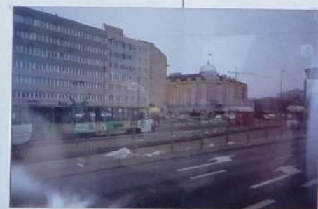
Прогулка по вечерней Варшаве. Ул.Маршалковская, Старе-Място ( Старый город 14-15 вв.)