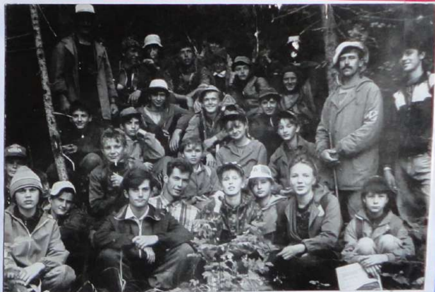
Экспедиция завершена - фото на память: учащиеся школы пос. Соляная и учащиеся школы №85. Неделя пролетела незаметно, но подружиться крепко успели.