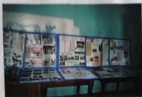
Экспозиция «Б.М.» – иллюстрация работы