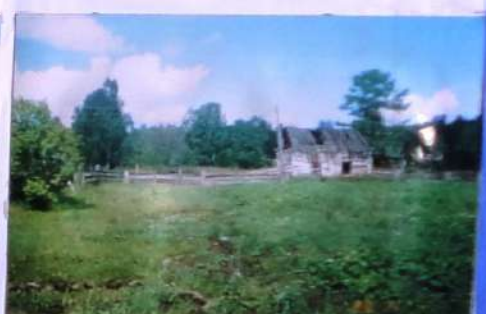
Цели экспедиции 1998 г. стало установление мест дислокации лагерей пугача Оверга и стар. поселка в ст. Д. Малоземля - восстановлении поселка лагерного пугача Оверга.