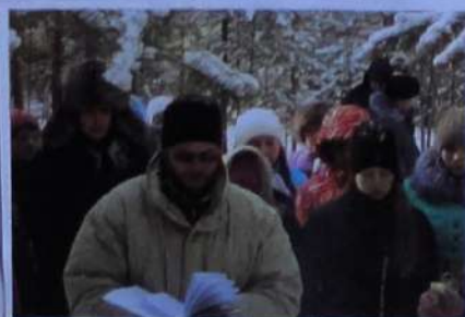
29 октября 2016 г., кладбище Озерлага ст.Топорок, ко Дню памяти жертв политических репрессий