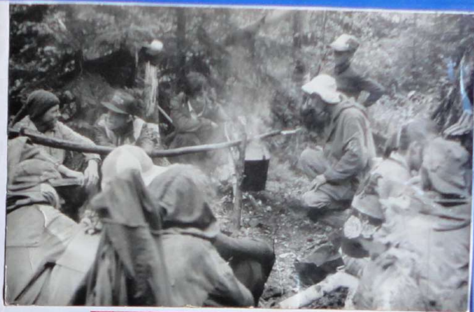
Путь к таежному руднику был долгим, но интересным. Участки экспедиции на привале.