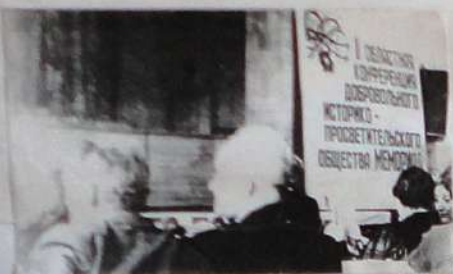
Двенадцатая тематическая конференция. На ней — в зале учатся в работе 1-ые общества историко-просветительских организаций области "История".