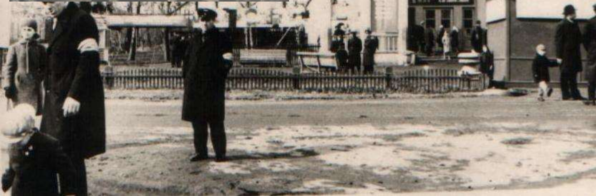
Первый кинотеатр г.Тайшета – «Победа», построенный в 1950 г. Подробнее на сайте Тайшетская история : Рубцов П. История кинофикации Тайшетского района