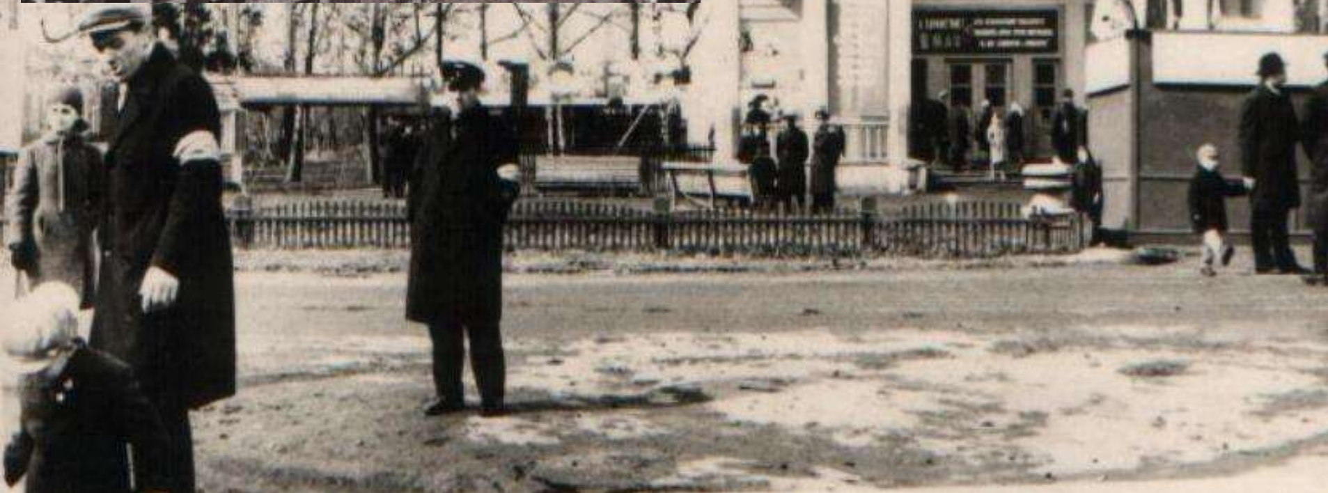
Первая официальная площадь Тайшета довоенных времен - им. Кирова С.М., образуемая перекрестком улиц Советская- им.Кирова – им.Чапаева перед зданием