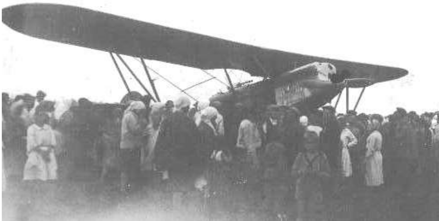
Первый аэродром/аэропорт Тайшета. Его существование в 1935-1937 гг. подтверждается документально. На снимке: прибытие делегатов 1-го Съезда передовиков культуры и производства в Тайшет, лето 1935 г