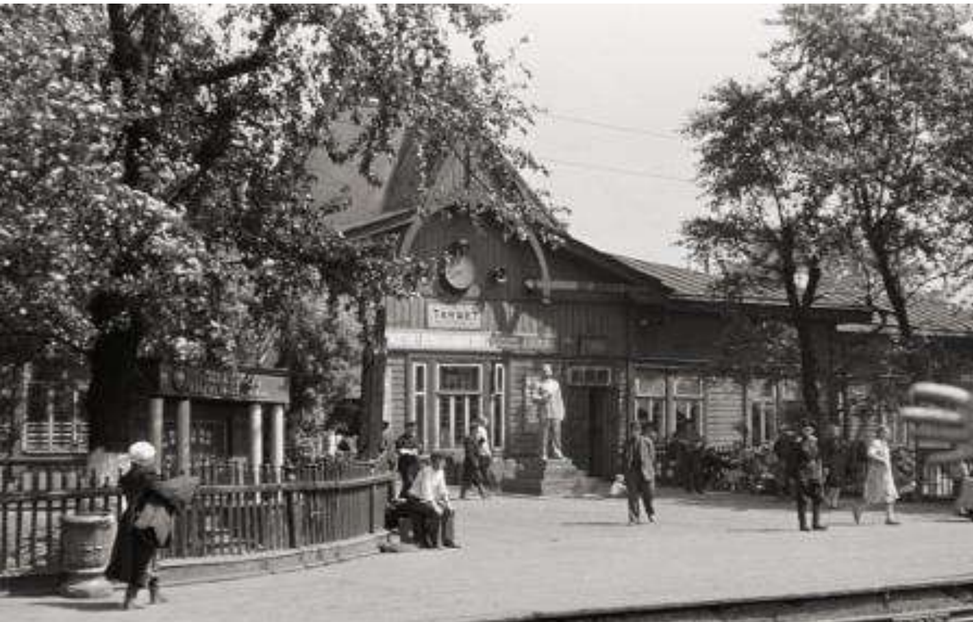
Единственный уличный памятник Сталину в Тайшете , 1957 год, перрон Ж.д. вокзала