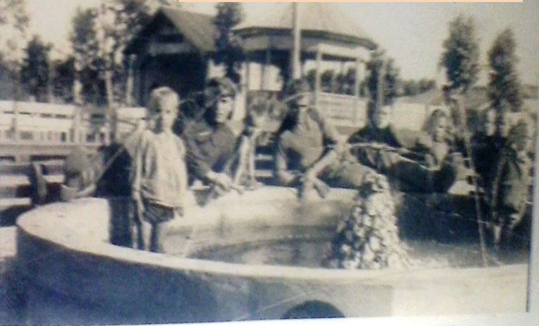
Железнодорожный сад. Фонтан – любимое место отдыха тайшетцев. 1938 г.г.